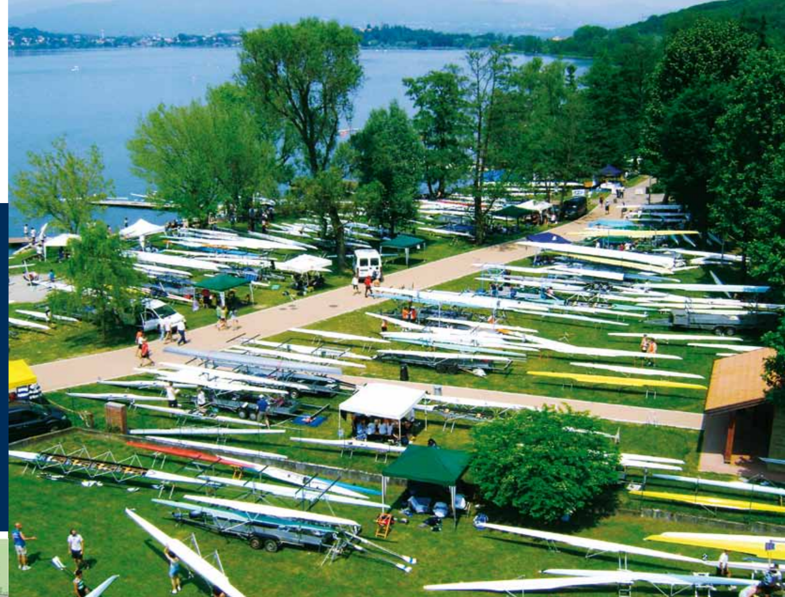
Planimetria Spiaggia Comunale "I Prej" e Centro Canottaggio CANOTTIERI CORGENO